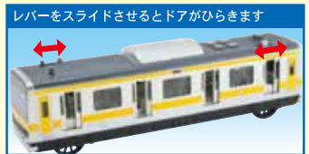
レバーをスライドさせるとドアがひらきます