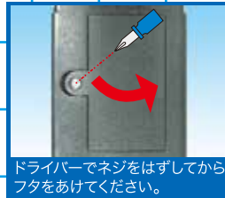
ドライバーでネジをはずしてからフタをあけてください。