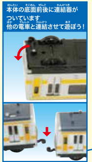
本体の底面前後に接続器がついています。他の電車と連結させて遊ぼう！