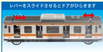
レバーをスライドさせるとドアがひらきます