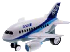
サウンドジェット ANA787