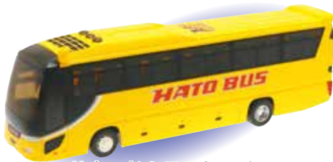
サウンド&ライト はとバス