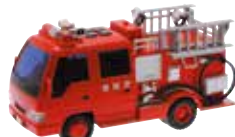
サウンドポンプ消防車