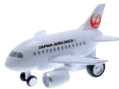
サウンドジェット JAL787