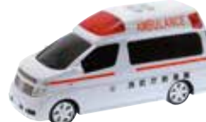
エルブランド救急車